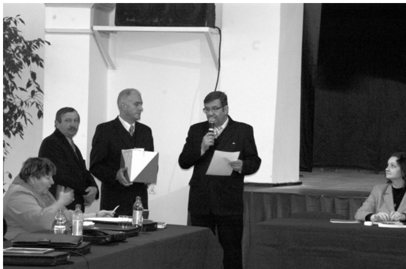
Komisja skrutacyjna przedstawia wyniki wyborów na przewodniczącą.