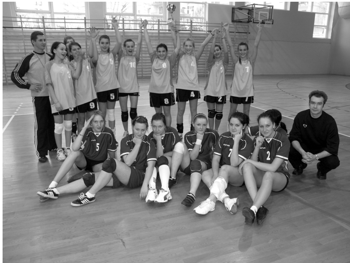
Dziewczęta, które stoją, zajęły pierwsze miejsce, dziewczęta siedzące zajęły II miejsce.