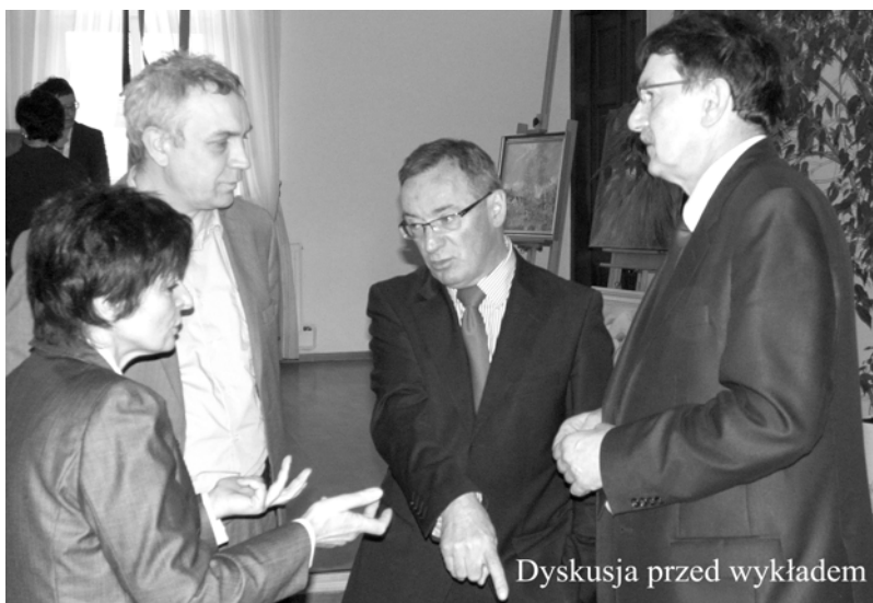
Dyskusja przed wykładem

jeśli jest to osoba prawna, bądź to podatku dochodowego od osób fizycznych, jeśli taką działalność prowadzi i taką umowę zawarła osoba fizyczna.