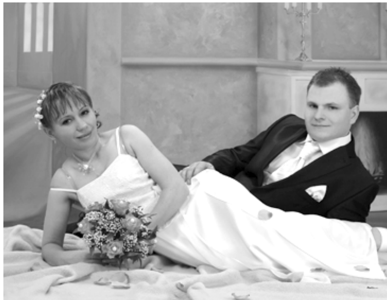
Foto-Video „Krzyś” ul. 1Maja 20, tel. 94 3653 338 www.fotopyrczak.pl