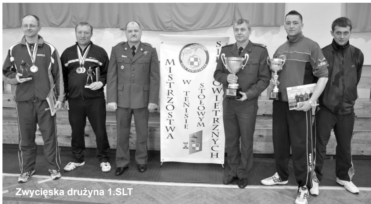
Zwycięska drużyna 1.SLT