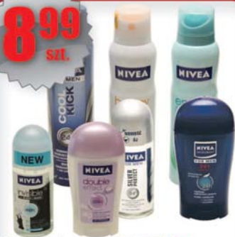
Deo, roll-on, sztyft NIVEA