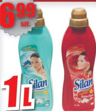
Płyn do płukania tkanin SILAN