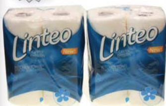
Ręcznik papierowy A'2 LINEA