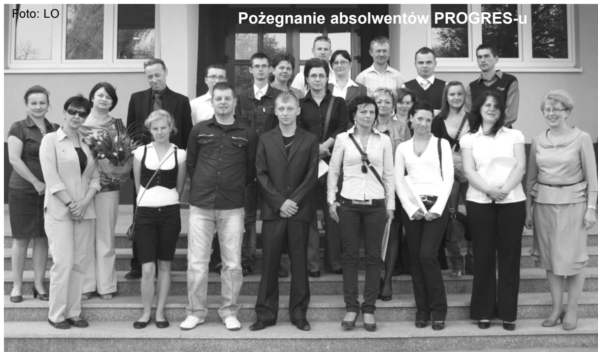
Pożegnanie absolwentów PROGRES-u