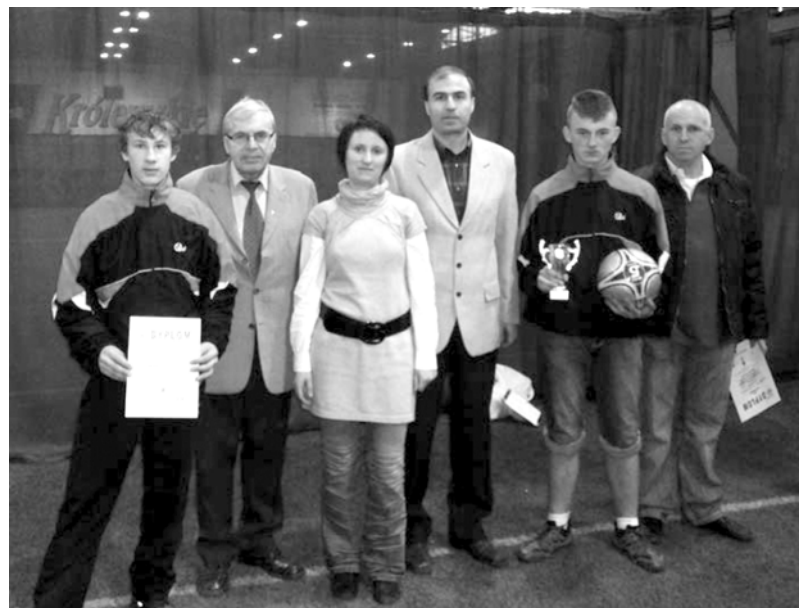
cja z rówieśnikami z wielu rejonów Polski.

Podczas uroczystej dekoracji uczestnikom mistrzostw wręczano puchary, medale i upominki. Dodatkową atrakcją było zwiedzanie zabytków Warszawy oraz integra-