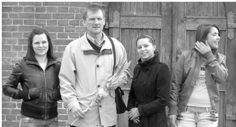
Autor z absolwentkami i uczennicą ZSP w Połczynie-Zdroju

W 1818, została wybudowana w wiosce pierwsza szkoła. Lokalne warunki dla rozwoju rolnictwa były dobre,