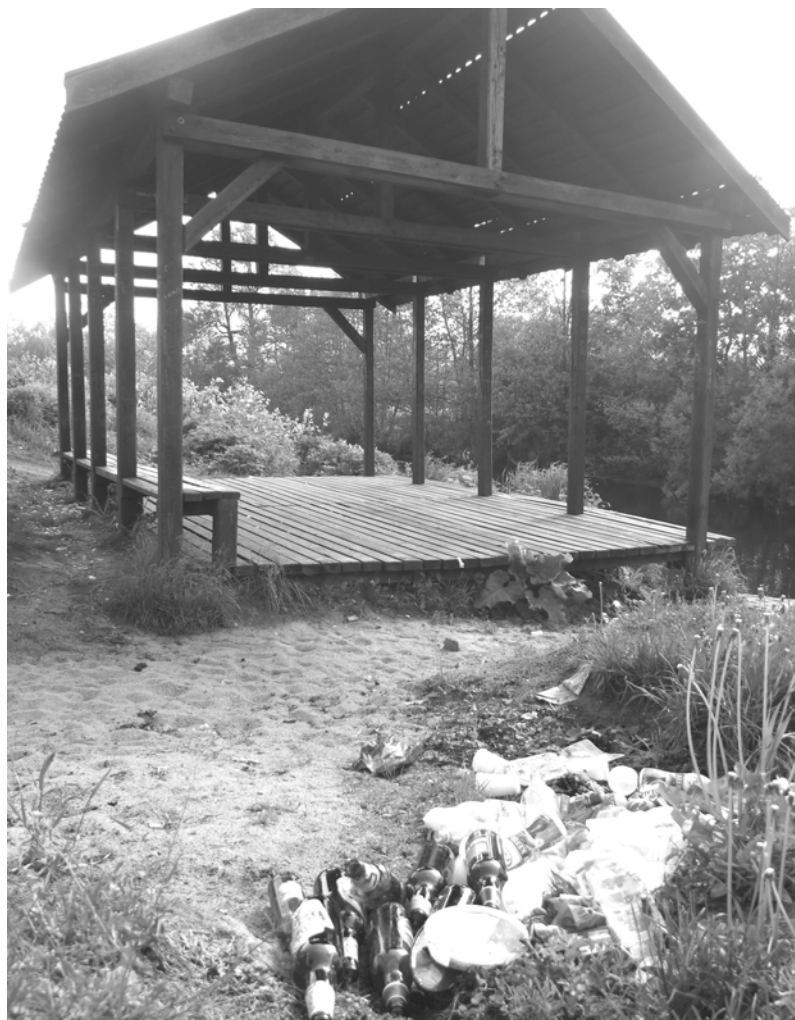
Przystań kajakowa w Łobzie