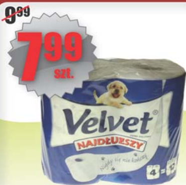
Papier Najdłuższy VELVET A'4