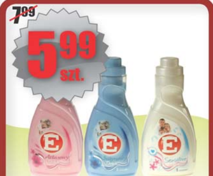
Koncentrat do płukania E 1 l = 5 99