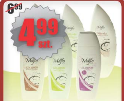
Szampony i odżywki MAJLO