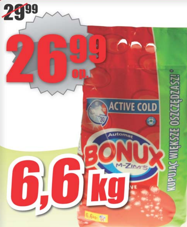
Proszek do prania BONUX