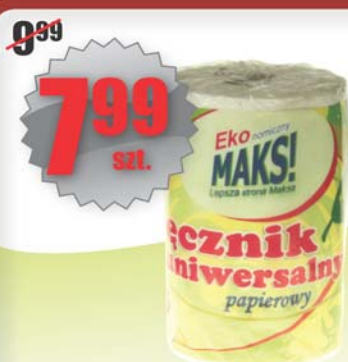
Ręcznik uniwersalny 55=6 MAKS