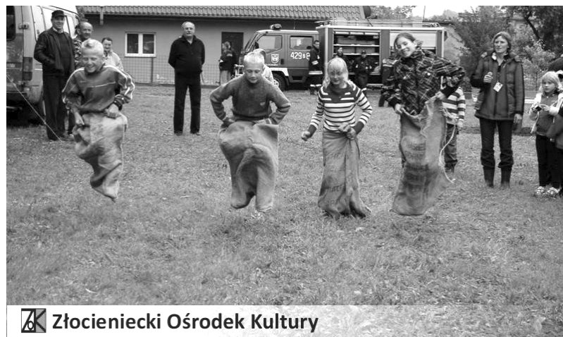
Złocieniecki Ośrodek Kultury