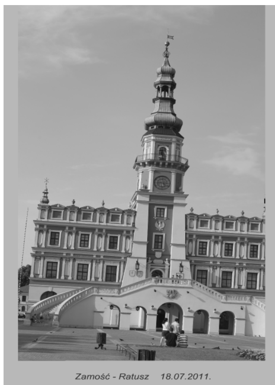
Zamość - Ratusz 18.07.2011.