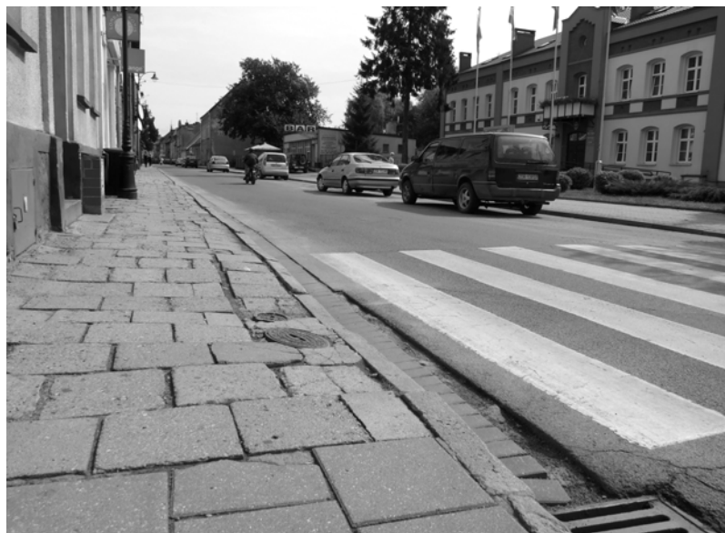
Naprzeciw Urzędu Miejskiego