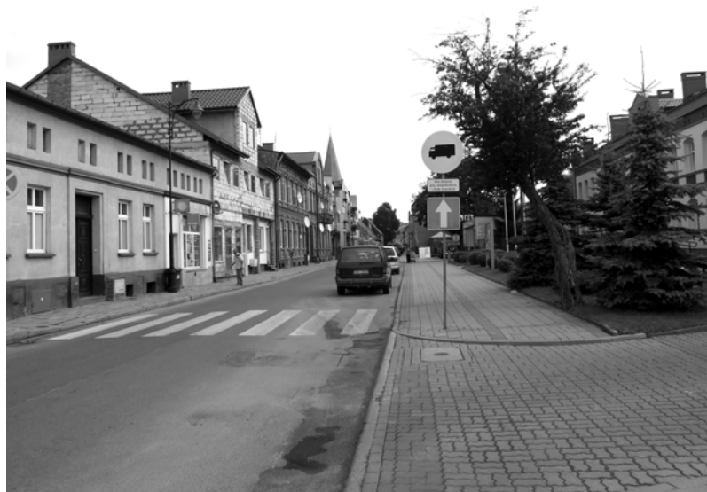
Przy Urzędzie Miejskim

Wkrótce ma rozpocząć się remont elewacji budynku urzędu miejskiego w Drawsku Pom.