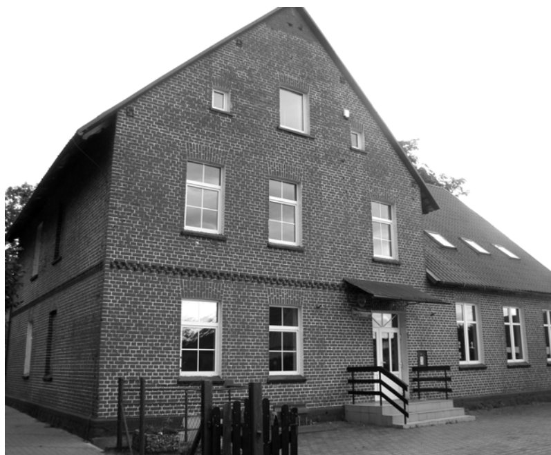
Powyżej: zamknięty budynek szkoły w Wicimicach

Wiceburmistrz zapewnia, że rozmowy o przeniesieniu szkoły do Modlimowa były prowadzone z mieszkańcami i rodzicami od początku tego roku. Przekonuje, że w Modlimowie jest najlepsza baza oświatowa, gdyż przy szkole wybudowano boisko ze sztuczną nawierzchnią, plac zabaw, a sambudynek dwa lata temu przeszedł kapitalny remont.