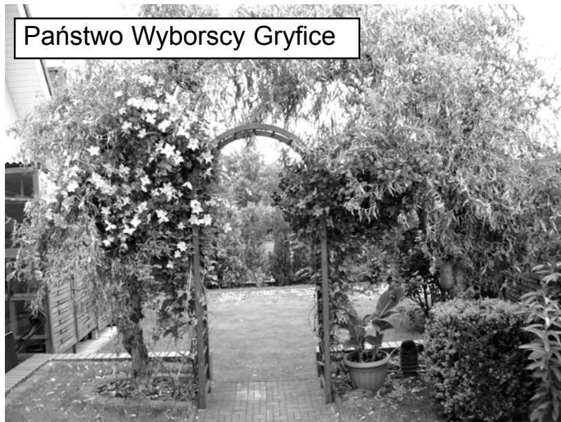
Państwo Wyborscy Gryfice

Zwyczajowo na dożynkach gminnych ogłoszono wyniki konkursu pt. „Mój balkon, mój ogród przydomowy, moja działka ogrodowa pełna kwiatów” organizowanego przez Gminę Gryfice.