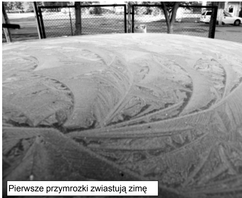
Pierwsze przymrozki zwiastują zimą