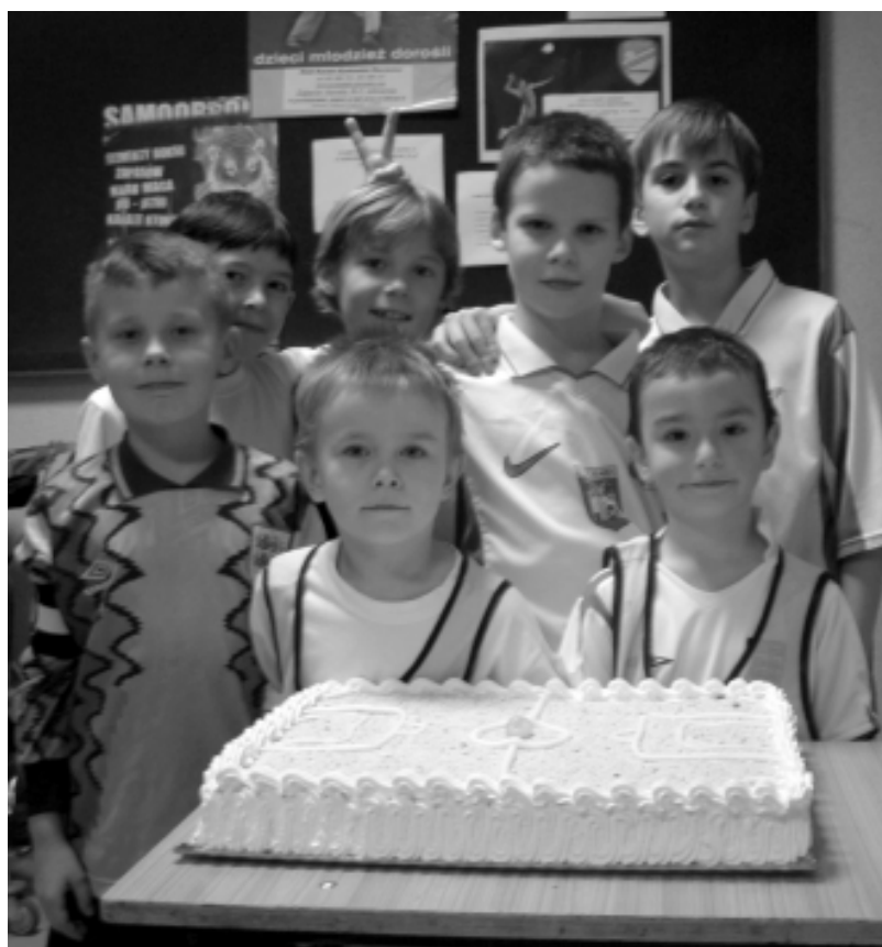
Piłkarze z UKS Orlik II i III Złocieniec zabierają się do skosztowania tortu.