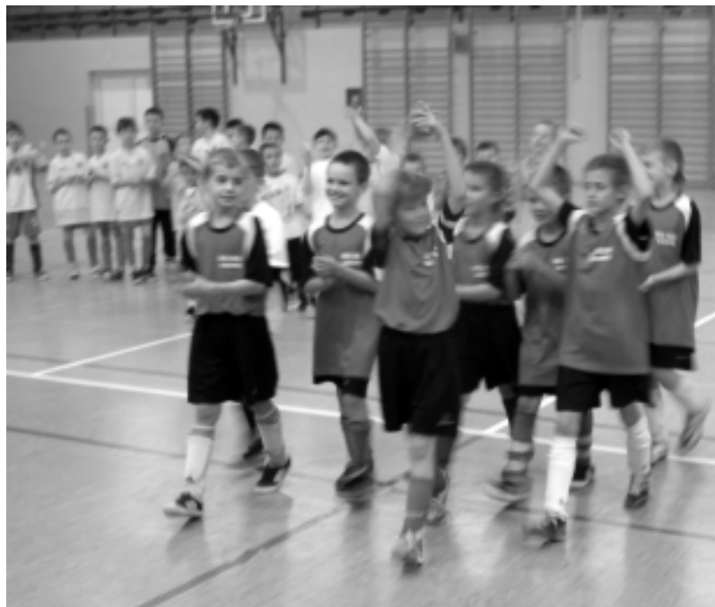
Drużyna UKS Orlik Złocieniec cieszy się ze zwycięstwa