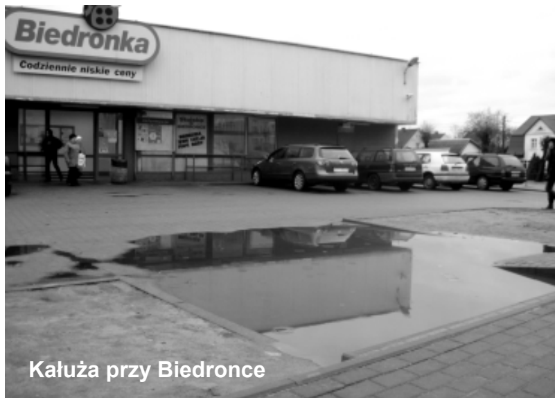
Kałūza przy Biedronce