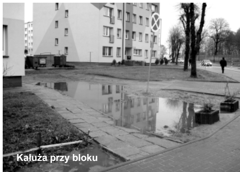
Kałūza przy bloku

W ubiegłym roku trwała przebudowa ulic Jana Dąbskiego i Sportowej. Pod koniec 2011 r. ulice te (z dużym poślizgiem) zostały oddane do użytku. Ale co się polepszyło?