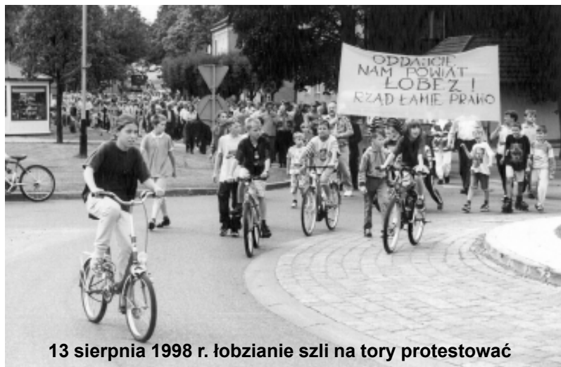
13 sierpnia 1998 r. łobzianie szli na tory protestować