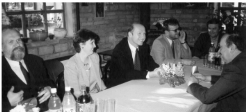
Maciej Płażyński (zginął w Smoleńsku) w restauracji Tradycja (teraz Polomarekt)

Po licznych działaniach Związku Miast Walczących o Powiat rząd w 2001 r. powołuje do życia 7 dodatkowych powiatów. Łącznie jest ich 314. Jest wśród nich Powiat Łobeski. Rząd tworzy Powiat Łobeski (w organizacji) i powołuje starostwo w Łobzie z dniem 1 stycznia 2002 roku. Wybory do Rady Powiatu Łobeskiego odbędą się jesienią 2002 r. Przeciwno temu rozwiązaniu protestuje grupa mieszkańców Reska, na czele z radną Powiatu