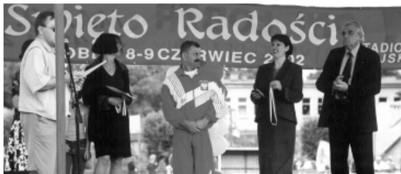
Prof. Zbigniew Religa na Święcie Radości w 2002 roku