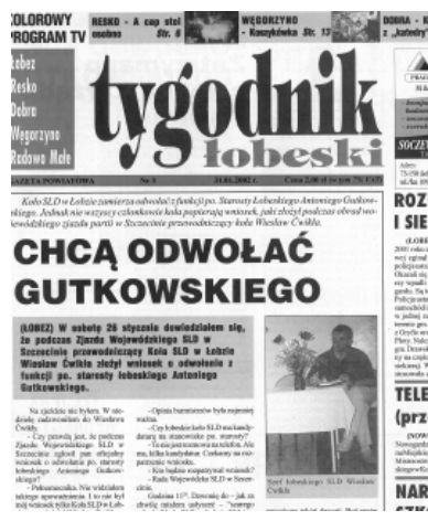
Nr 3 z dnia 31 stycznia 2002 r.

(POWIAT). W tym roku nasz Tygodnik obchodzi 10. lat istnienia, liczy sobie dokładnie tyle lat, ile ma powiat łobeski. Pierwszy numer ukazał się 17 stycznia 2002 r.