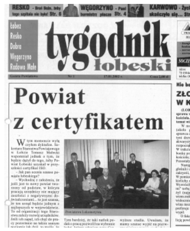
Nr 1 z dnia 17 stycznia 2002 r.