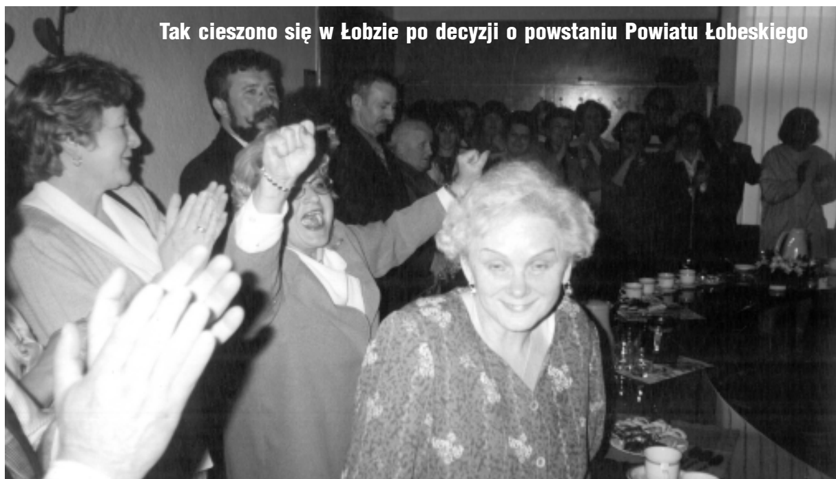
Tak cieszą się w Łobzie po decyzji o powstaniu Powiatu Łobeskiego