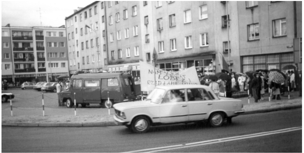
Mieszkańcy codziennie zbierali się na placu 3 Marca, nawet jak padał deszcz.