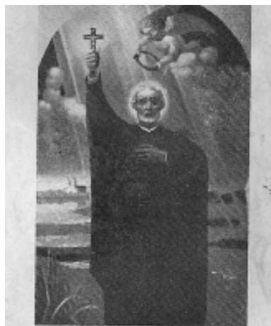
Święty Andrzej Boboło, Proroku Niepodległości naszej i Patronie Polski, a zwłaszcza jej kresów wschodnich, módl się za nami.

Stałem. Chwila zadumy. I wreszcie decyzja: Muszę iść. Odrzuciłem na bok ten kostur. Wstąpiła na mnie jakby wielka siła i jak żołnierz na rozkaz „Krokiem marsz”, ruszyłem do przodu. Tak jak pełnosprawny człowiek normalnym krokiem przeszedłem po kładce przez rzekę, potem nawet podbiega-