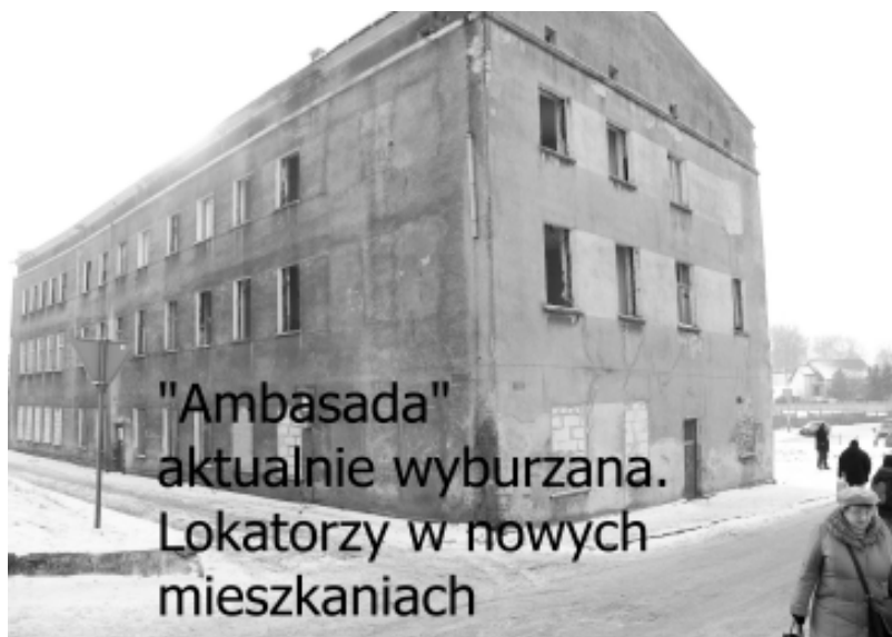
"Ambasada" aktualnie wyburzana. Lokatorzy w nowych mieszkaniach