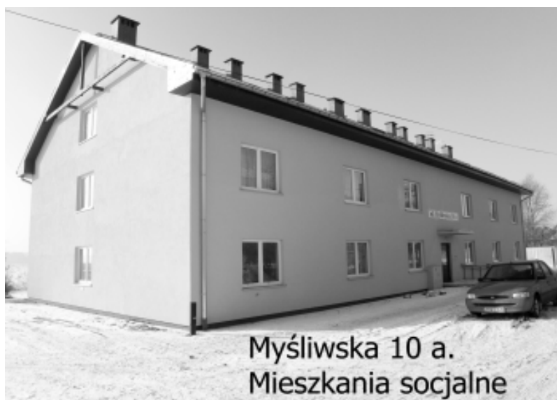
Myśliwska 10 a. Mieszkania socjalne