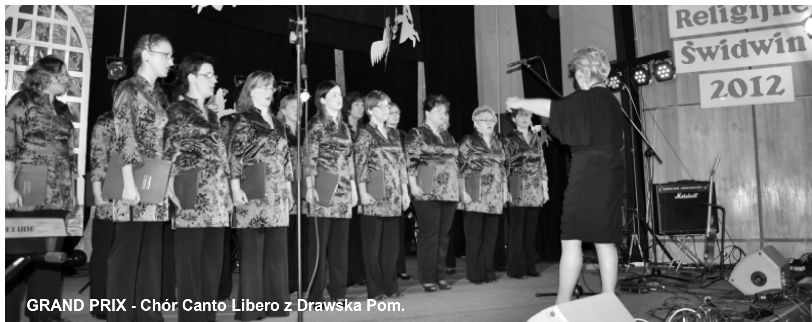
GRAND PRIX - Chór Canto Libero z Drawska Pom.