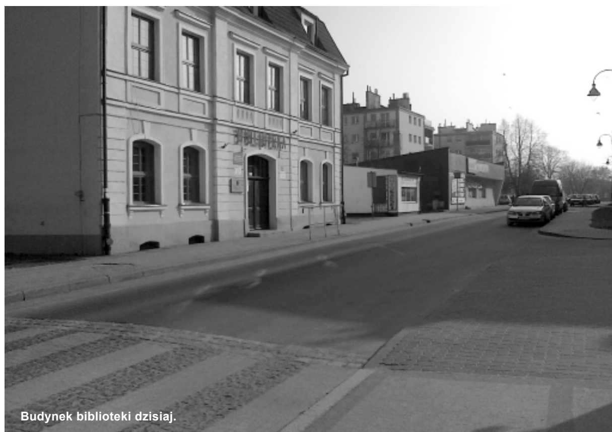
Budynek biblioteki dzisiaj.

wiedział Gryfice i był gościem Oficerskiej Szkoły Piechoty Nr 2, która mieściła się w obecnym Gimnazjum nr 1. W tle zamieszczonego zdjęcia widzimy kamienice, które prawdopodobnie zostały zniszczone na skutek działań tzw. szklarzy, czyli żołnierzy radzieckich, którzy po splądrowaniu domów podpalali budynki, aby nie było dowodów ich działalności. Jedną z tych kamienic, po remontach i rekonstrukcji, pod nadzorem konserwatora zabytków, możemy dzisiaj oglądać w naszym pięknym mieście. Okazała kamienica wybudowana została w okresie baroku i należeć musiała do bogatego mieszczanina. Nie trzeba chyba nikomu przypominać, że obecnie mieści się w niej Miejska Biblioteka Publiczna. Odbudowę tego budynku rozpoczęto w 1977 r., a zakończono na początku 1982 r. Ponownie oddany został do użytku 3 maja 1982 roku.