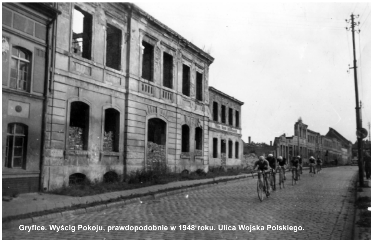
Gryfice. Wyścig Pokoju, prawdopodobnie w 1948 roku. Ulica Wojska Polskiego.

Trasa wyścigu biegła przez Gryfice, między innymi ulicą o niemieckiej nazwie Koning Strasse, która później nosiła nazwę Marszałka Michała Rola-Żymierskiego, a obecnie Wojska Polskiego. Warto nadmienić, że Marszałek Michał Rola-Żymierski od-