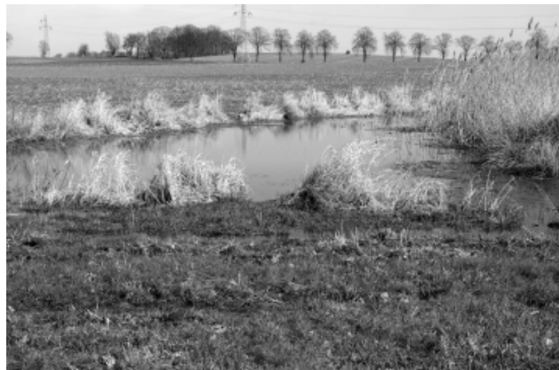
Przy tym bagienku doszło do napadu i pobicia