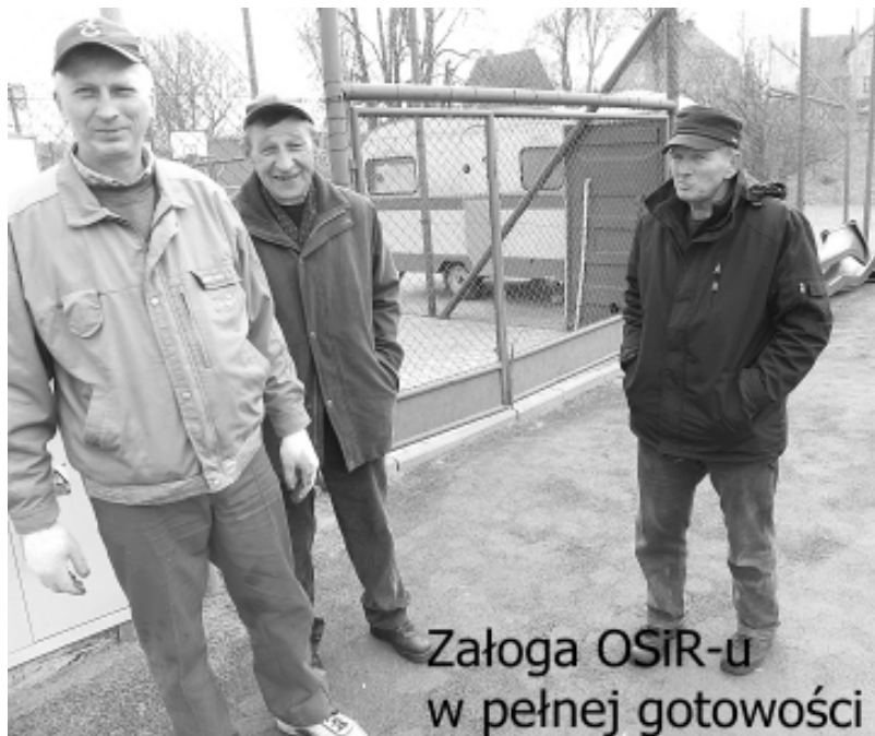
Załoga OSiR-u w pełnej gotowości