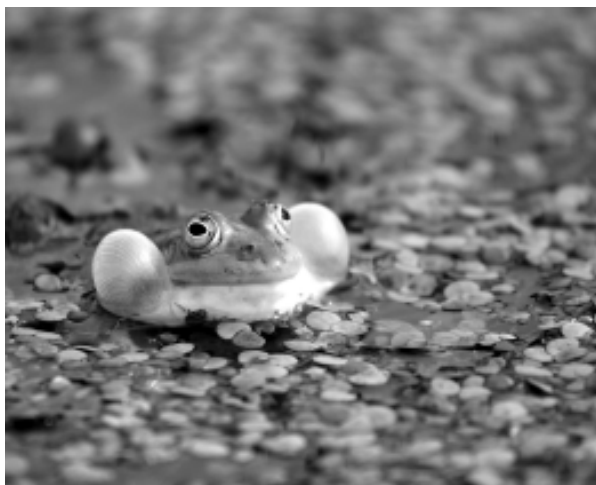
Praca Marcina Czaplewskiego

W tej szkole nikt nie lubi stresów - panuje tu tolerancja oraz przyjazna i rodzinna atmosfera. Nic dziwnego, że uczniowie i rodzice chętnie angażują się w organizowanie życia pozaszkolnego. Działa cały szereg przedmiotowych kół zainteresowań, szkolna gazetka (w nowoczesnej formie bloga) „Stachu w podziemiach”, koło teatralne, filmowe, fotograficzne i dziennikarskie. Jest tu również fantastycznie zaopatrzona w nowości biblioteka, w której dyskusje o książkach stały się już tradycją. (o)