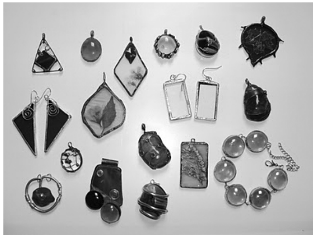
Praca Zuzi Ślusarczyk