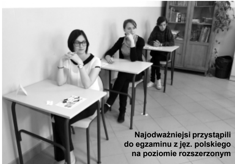
Najodważniejsi przystąpili do egzaminu z jęz. polskiego na poziomie rozszerzonym

Tegoroczni absolwenci szkół średnich mają już za sobą pierwszy egzamin maturalny. Porównanie stronnictw na balu u Senatora z III Części „Dziadów” Adama Mickiewicza oraz charakterystyka bohaterów „Lalki” i „Ludzi bezdomnych”, czyli Izabeli i Joanny - takie były tematy do wyboru na maturze z języka polskiego na poziomie podstawowym.