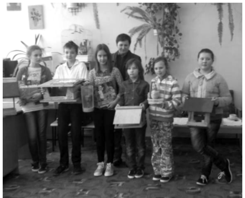
Zwycięzcy oraz uczniowie wyróżnieni w konkursie na najładniejszy karmnik.