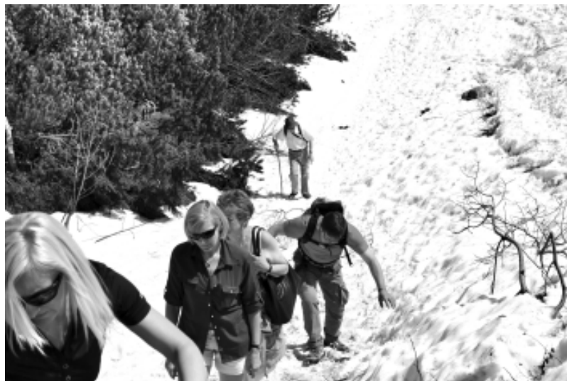
Tak się zdobywa Dolinę Pięciu Stawów

Z dworców PKP, PKS i busików, które są zlokalizowane w tym sa-