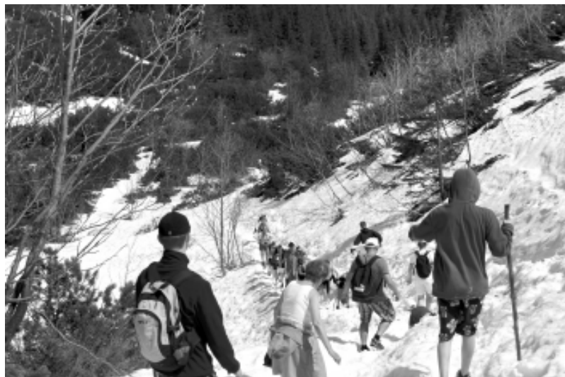
Niektórzy wracają w dół