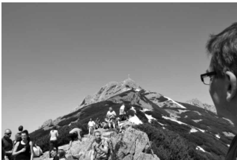
Jeszcze chwila i z Giewontu zobaczymy Zakopane

Najłatwiejszymi szlakami do zdobycia okazały się Szlak do Morskiego Oka, po Dolinie Kościeliskiej i po Dolinie Chochołowskiej. W tej ostatniej można było kupić produkty z owczego mleka bezpośrednio od producenta, posmakować