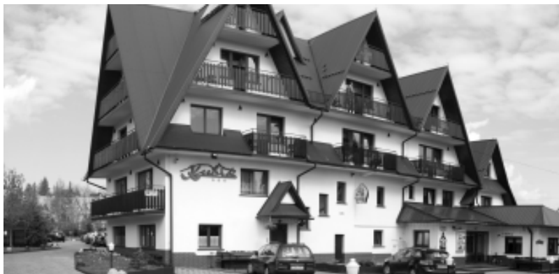
Główna część budynku

Minął czas wydłużonego odpoczynku od codzienności. Każdy tą możliwość wykorzystywał według własnego uznania. Niektórzy też musieli pracować lub pełnić służbę. Dyrekcja naszej Szkoły Podstawowej w Węgorzynie postanowiła zagospodarować ten czas na zorganizowany i aktywny wypoczynek w górach. Trzeba było sięgnąć do najwyższej półki możliwości i wybrano Tatry, bo one to w Polsce są najwyższe z Kościołem Polski na Giewoncie.