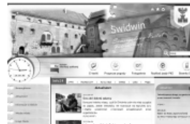
Portal 2009-2012 przeszedł do historii.

Kolejne zmiany przeprowadzamy z nadzieją poprawy funkcjonalności portalu, aczkolwiek z zachowaniem układu, do którego przywykli użytkownicy oraz charakterystycznej brązowej kolorystyki. Odświeżamy nieco wygląd, wprowadzamy nowe zdjęcia, które będą witać internautów na stronie głównej. W dalszym ciągu w pierwszej kolejności będzie się wyświetlał najchętniej czytany dział - aktualności. Uporządkowaliśmy nieco rozrzucone do tej pory ikony odsyłające do innych działów - znajdują się one z prawej strony. Do górnego menu przenieśliśmy wirtualny spacer po Świdwinie. Mapa serwisu pozwalała wygodnie poruszenie się po całej stronie, można stamtąd także w każdej chwili wrócić do strony głównej. Znajdują się tam - podobnie, jak i w poprzedniej wersji - fotogaleria i wirtualne kartki, natomiast całkowicie inna jest zawartość tych działów. W ciągu kilku lat Świdwin zmienił się tak bardzo, że wiele zdjęć było już nieaktualnych... Zmieniliśmy także dość radykalnie dział „kultura”. Prawie w każdym dziale wprowadziliśmy również drobniejsze zmiany wynikające głównie z dezaktualizacji niektórych informacji.