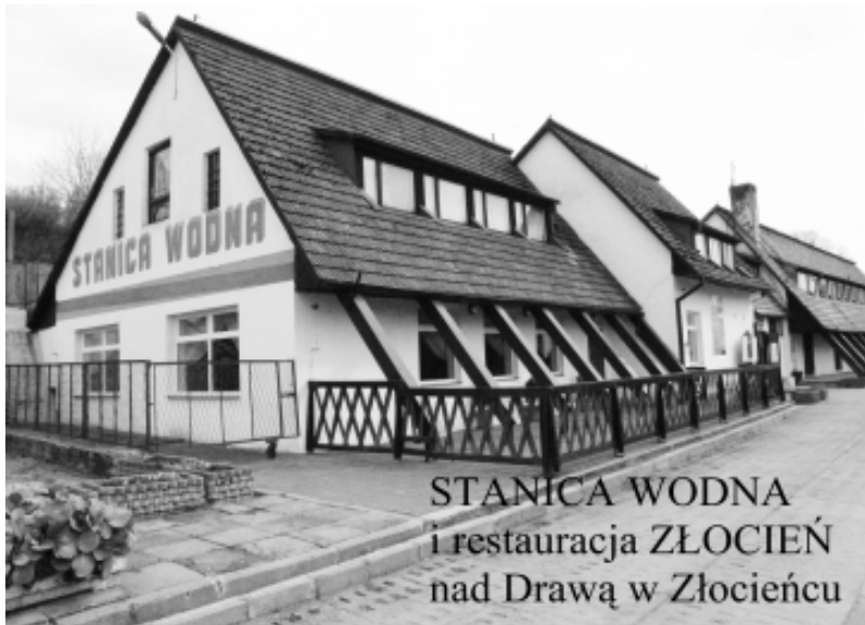
STANICA WODNA i restauracja ZŁOCIEN nad Drawą w Złocieniu

truskawki drogie. Cena trzyma sztywno - powyżej ośmiu złotych.