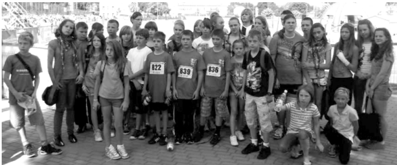
Łobescy lekkoatleci „czwartkowicze” na stadionie AZS w Łodzi

Łódź była gospodarzem 18. Ogólnopolskich Finałów „Czwartków Lekkoatletycznych”.