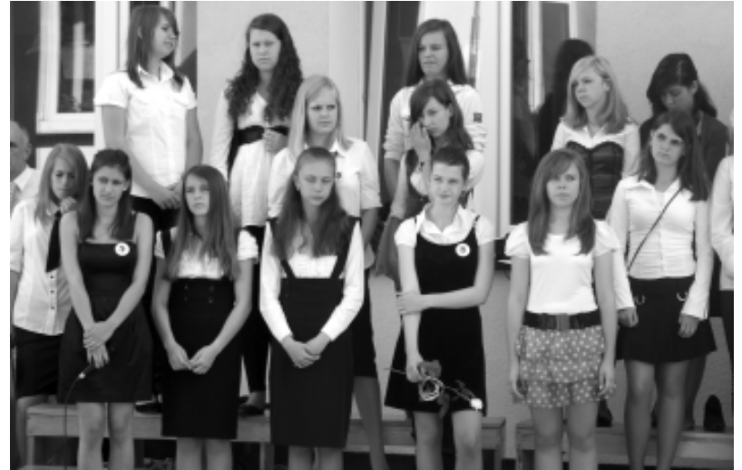
Pożegnanie roku szkolnego w gimnazjum w Łobzie

Szkołę Podstawową w Siedlicach ukończyło 54 uczniów, 1 osoba nie zdała. AB i KK