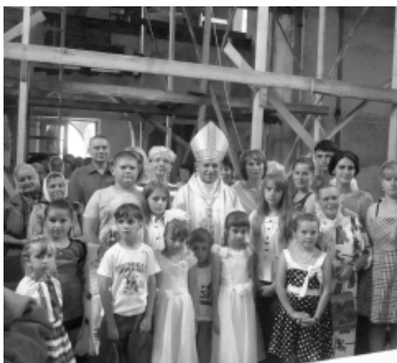
Arcybiskup z wiernymi