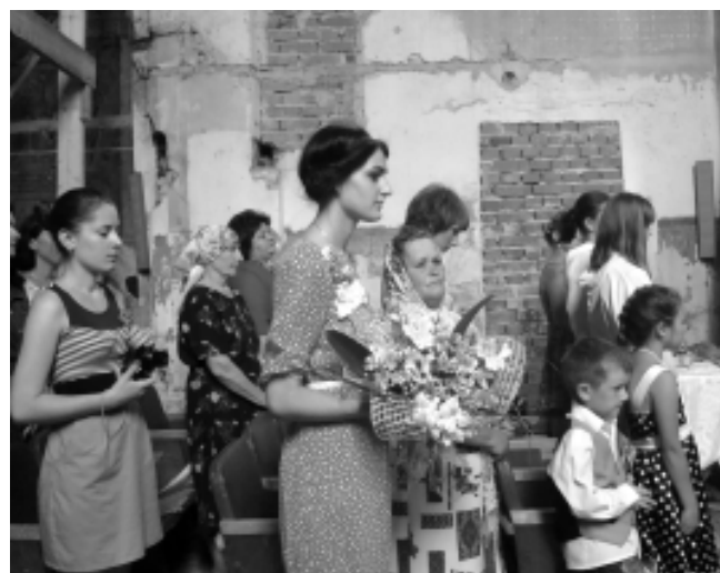
Wierni z Brzeżan i Kuropatnik witają arcybiskupa

Uczestnicy Mszy świętej odpustowej przed dzwonnica przy kościele w Kuropatnikach.