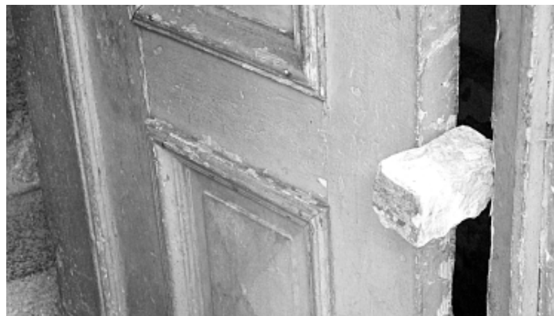
Podwóreczko pychotka gminna