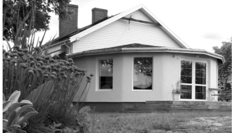
Gospodarstwo Agroturystyczne „Bogdaniec” w Winnikach

Gmina w całości leży w dorzeczu Regi, jednej z większych rzek zachodniego Pomorza, uchodzącej do Bałtyku w rejonie Mrzeżyna. Rega, przez pasjonatów kajakarstwa uznawana jest za jeden z najwspanialszych szlaków kajakowych w Polsce, wędkarze zaś mają okazję złapać w jej wodach pstrąga.