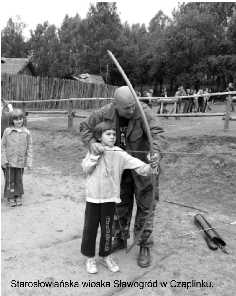
Starosłowińska wioska Sławogród w Czaplunku.

Wakacje to czas odpoczynku. Po trudach nauki uczniowie Szkoły Podstawowej nr 1 i Szkoły Podstawowej nr 2 w Łobzie wzięli udział w półkolonii.