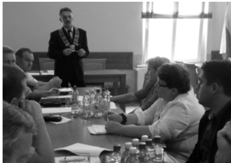
Przedstawiciel Betmixu (pierwszy z prawej) przedstawia swoją sytuację radnym na sesji

- Widziałem, że w tym czasie zostały tam położone tynki. Czy to znaczy, że zrobił wam je za darmo? – upierał się przedsiębiorca.