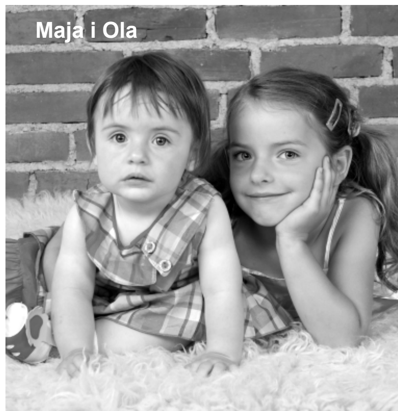
Zdjęcie do Galerii Tygodnika można wykonać w Foto-Video „Krzyś” w Łobzie, www.fotopyrczak.pl