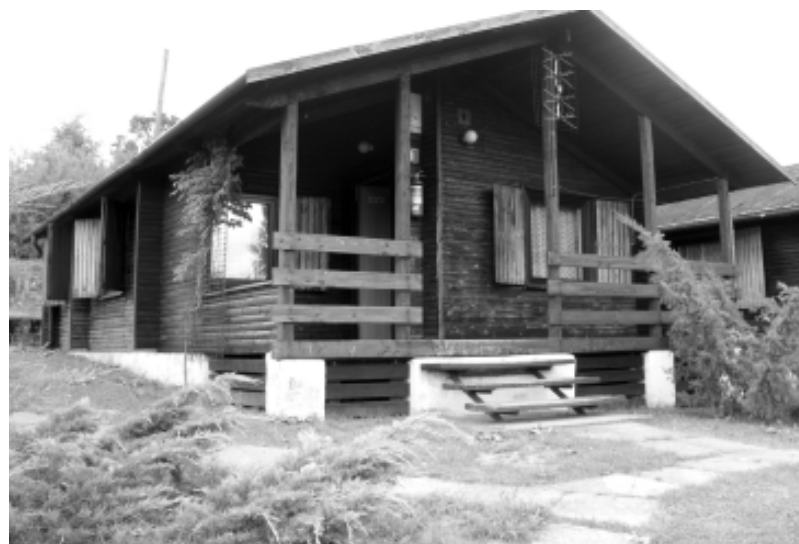
Domek w ośrodku wypoczynkowym „Przytoń”