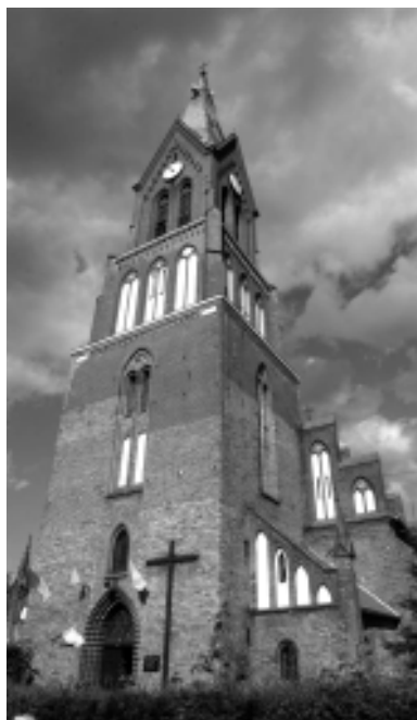
Resko. Kościół p.w. Niep. Poczęcia NMP

Czy jest szansa na rozwój turystyki? Ona będzie zawsze, jeśli ludzie będą mieli pieniądze, a niestety zauważalne jest ogólne zubożenie. W czasie kryzysu widać większy kontrast, niektórzy się w szybszym tempie bogacą, a inni mają coraz mniej pieniędzy. Mieliliśmy u nas ostatnio rodzinę ze Śląska. Opowiadali, że życie jest drogie, mają dwójkę dzieci w szkołach, ojciec był górnikiem, żona gdzieś dorabiała. Mówili, że jest im bardzo ciężko.