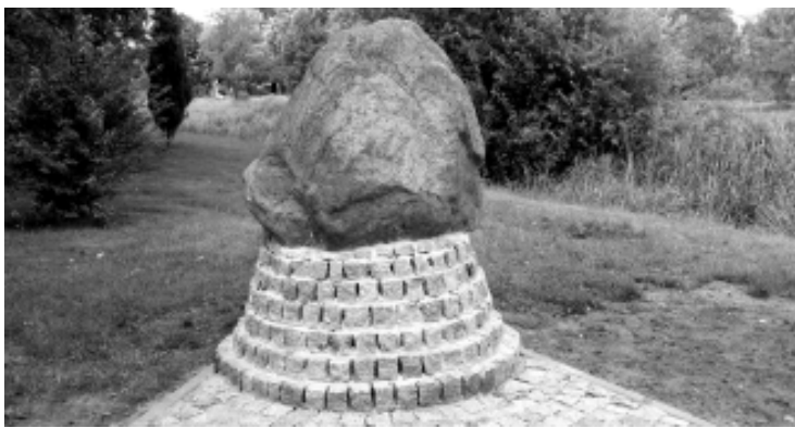
Kamień nad Regą przygotowany pod wmurowanie tablicy