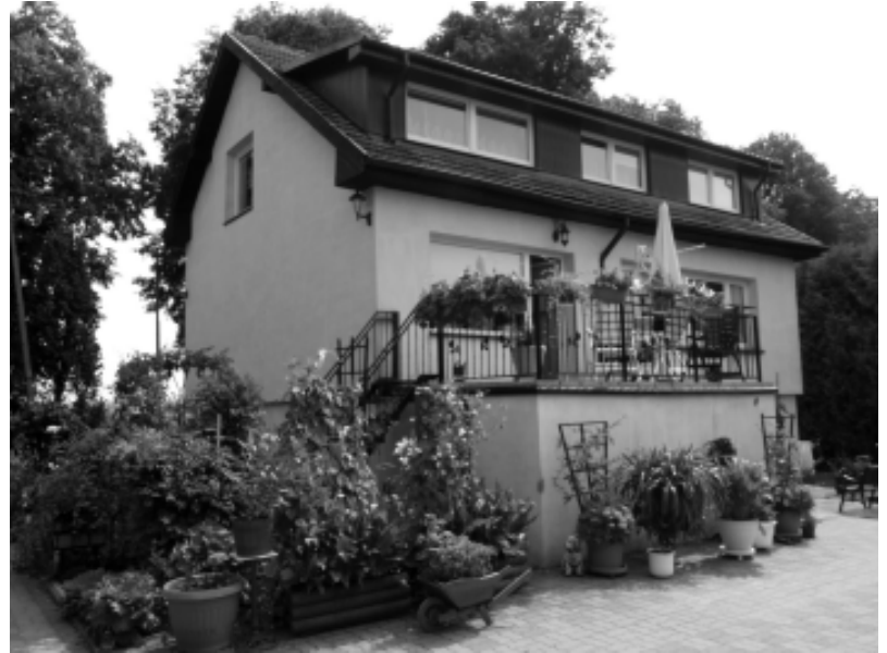
Gospodarstwo Agroturystyczne „Zagroda” w Ługowinie

Gmina Resko leży na Wysoczyźnie Łobeskiej oraz równinach: Nowogardzkiej i Gryfickiej. Przez miasto i gminę przepływają rzeki Rega oraz wpadająca do niej Ukleja. Obydwie rzeki stanowią niezwykle malowniczy i atrakcyjny przyrodniczy szlak kajakowy. Rzeka Rega nazywana królową pomorskich rzek, wije się przez ziemie łobeskie. Jest najdłuższą rzeką województwa zachodniopomorskiego. Ze względu na czystość wody żyją w niej pstrągi, płocie i szczupaki. To również jedna z nielicznych polskich rzek, do której wpływają na tarło łososie. Obfitość ryb oraz dostępność rzeki sprawiają, że te rejonny to również raj dla wędkarzy. Bystry nurt oraz porośnięte drzewami brzegi tworzące swoisty nastrój sprawiają, iż jest to jedna z ulubio-