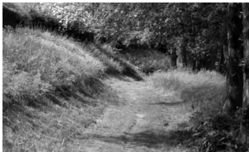
Ścieżka nad jeziorem w Starej Dobrzycy

Objęte strefą ciszy jezioro Dobrzyca, rzeka Rega i otaczające Resko ze wszystkich stron lasy mie-