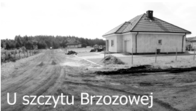
U szczytu Brzozowej