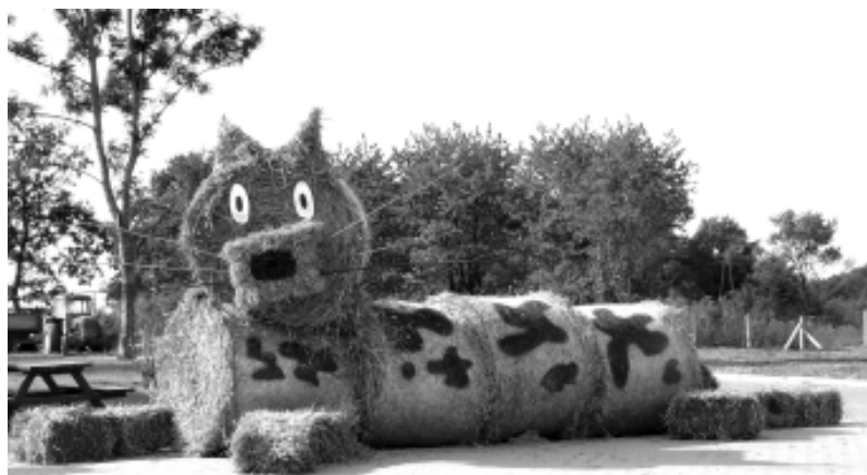
Kot sołtysa Ginawy.

Zbigniew Kędrazbike@onet.eu