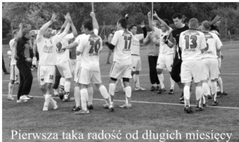
Pierwsza taka radość od długich miesięcy

(ZŁOCIENIEC). W szóstej kolejce rozgrywek Olimp Złocieniec poległ w Darłowiez Darłowią 0:3. W minioną sobotę (22 września) przyszło złocienianom w roli gospodarza grać liderem Iskrą Białogard.