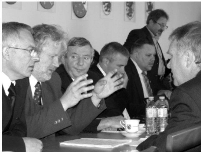
Tabela dodatków funkcyjnych

W ramach tego programu remontu doczekają się również ulice: Kamienna Brama, Wojska Polskiego i Armii Krajowej. MJ