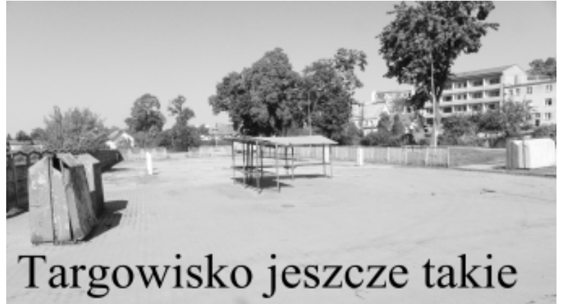
Targowisko jeszcze takie