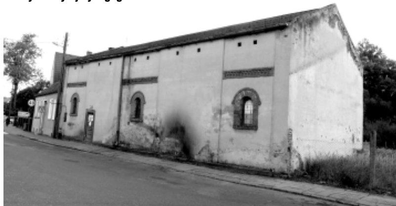
Budynek byłej synagogi w Resku