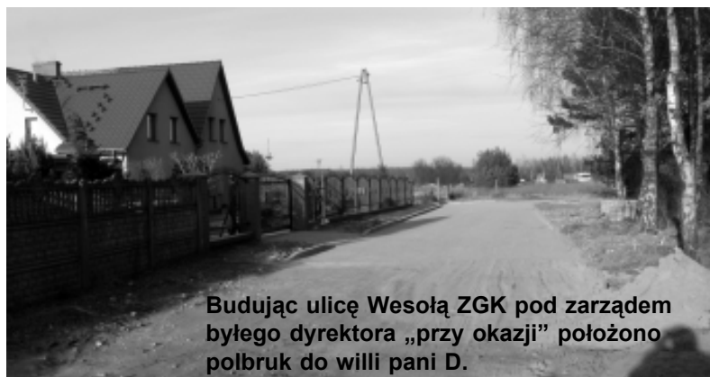
Budując ulicę Wesolą ZGK pod zarządem byłego dyrektora „przy okazji” położono polbruk do willi pani D.

PS. Ja z kolei zadumałem się nad podpisem pod zdjęciem w artykule „Radość na Wesolej”. Zdjęcie autorstwa ks. S. Marculi przedstawia kilkanaście osób stojących przy ognisku. Podpis pod zdjęciem brzmi: „Wspólne świętowanie z okazji otwarcia ulicy Wesolej”. Zastanawiam się nad semantyczną zapaścią dziennikarzy związanych z katolickim radiem, którzy nazwali spotkanie przy ognisku z okazji otwarcia kawałka ulicy „świętowaniem”. To jak by nazwali spotkanie z okazji otwarcia autostrady? Wniebowstąpieniem polityków ją otwierających? KAR