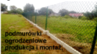
podmurówki ogrodzeniowe produkcja i montaż

pod siatkę, panele ogrodzeniowe i pergole ogrodowe od 18 zł/mb netto