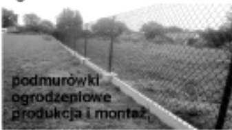
podmurówki ogrodzeniowe produkcja i montaż

pod siatkę, panele ogrodzeniowe i pergole ogrodowe od 18 zł/mb netto