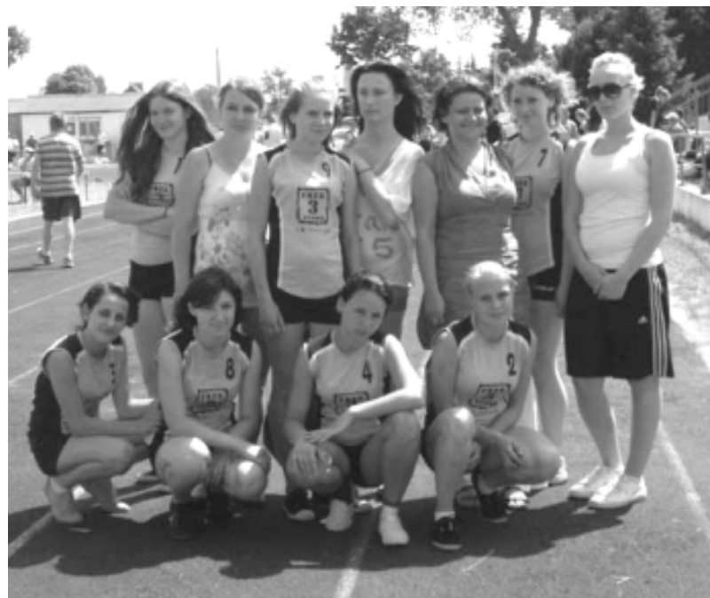
Reprezentacja Zespołu Szkół w Łobzie na finałach Wojewódzkiej Ligi Lekkoatletycznej w Stargardzie Szczecińskim

(WARSZAWA-ŁOBEZ) Zarząd Główny Szkolnego Związku Sportowego w Warszawie ogłosił listę rankingową najlepszych szkół ponadgimnazjalnych w zawodach pod nazwą Szkolna Liga Lekkoatletyczna. W gronie najlepszych drużyn w Polsce na 11. miejscu uplasowała się reprezentacja dziewcząt ZESPOŁU SZKÓŁ im. T. Kościuszki w Łobzie.