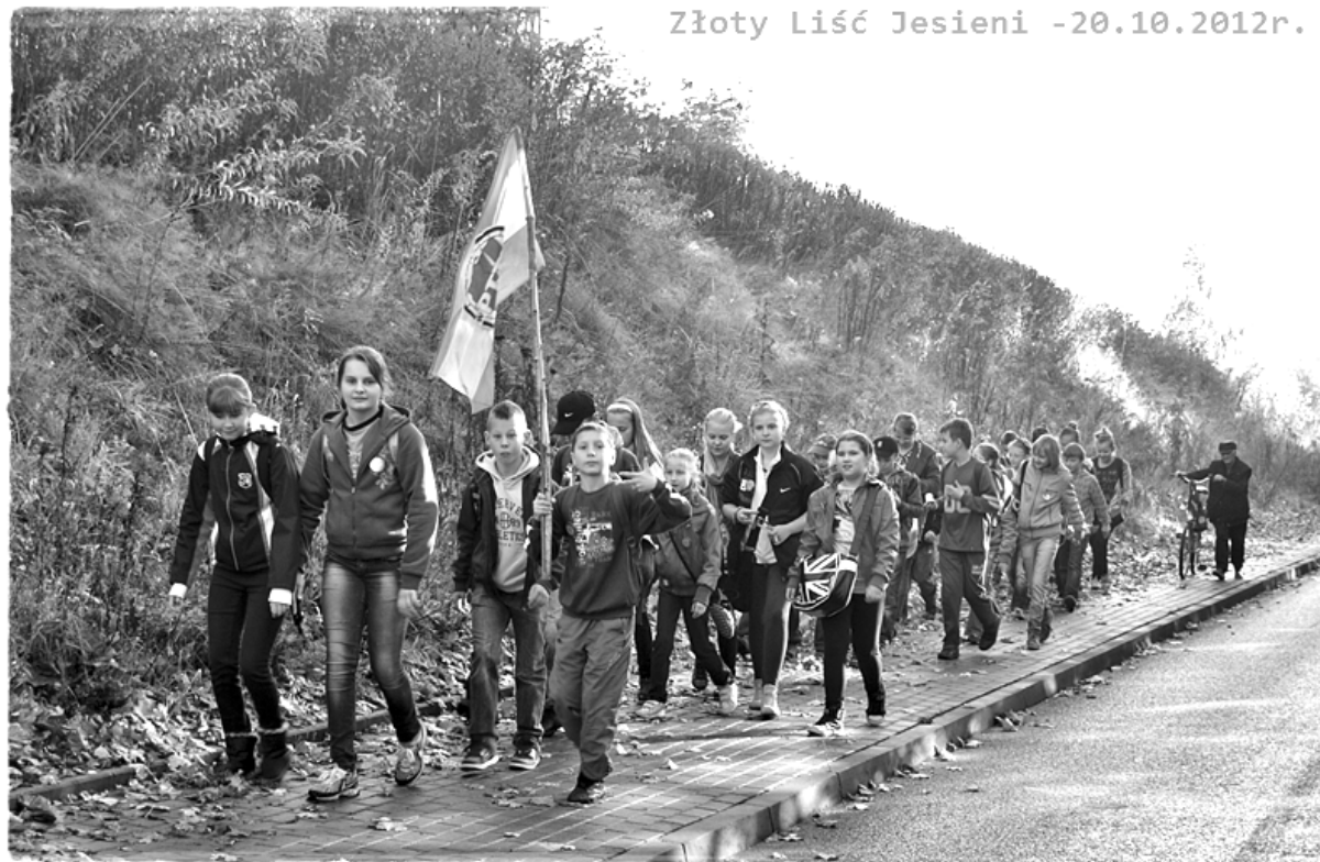
Złoty Liść Jesieni -20.10.2012r.