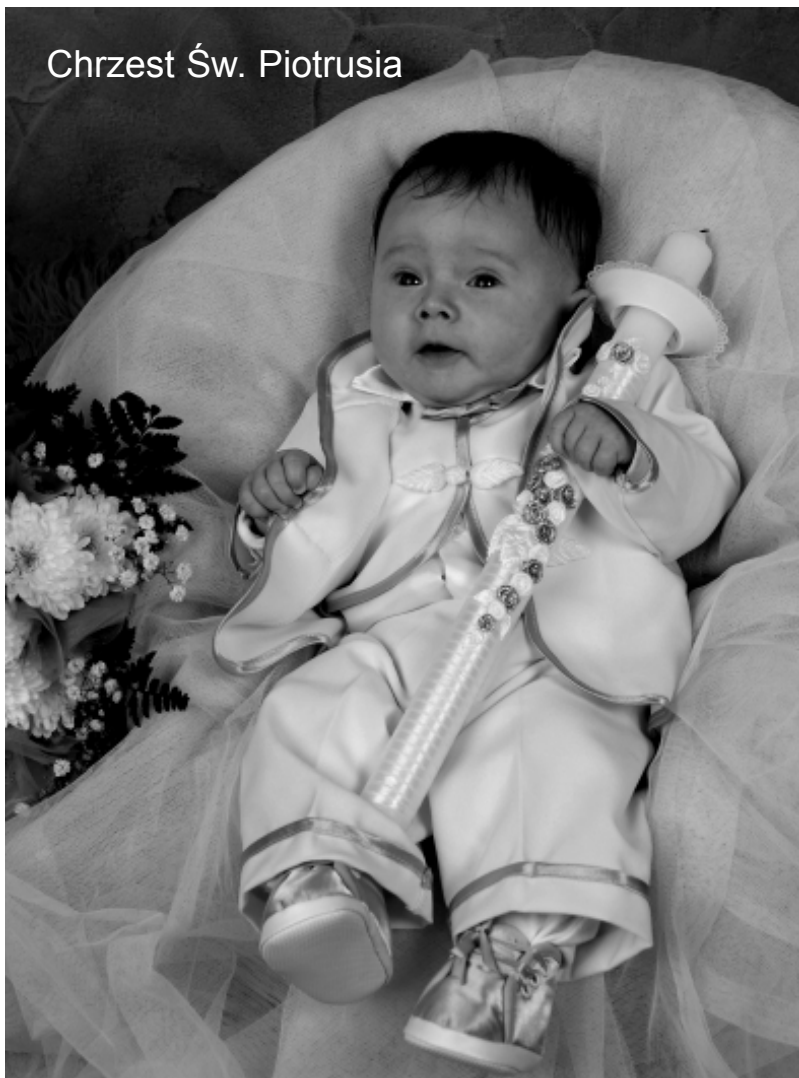
Chrzest Św. Piotrusia

Zdjęcie do Galerii tygodnika można wykonać w Foto-Video „Krzyś” w Łobzie, www.fotopyrczak.pl